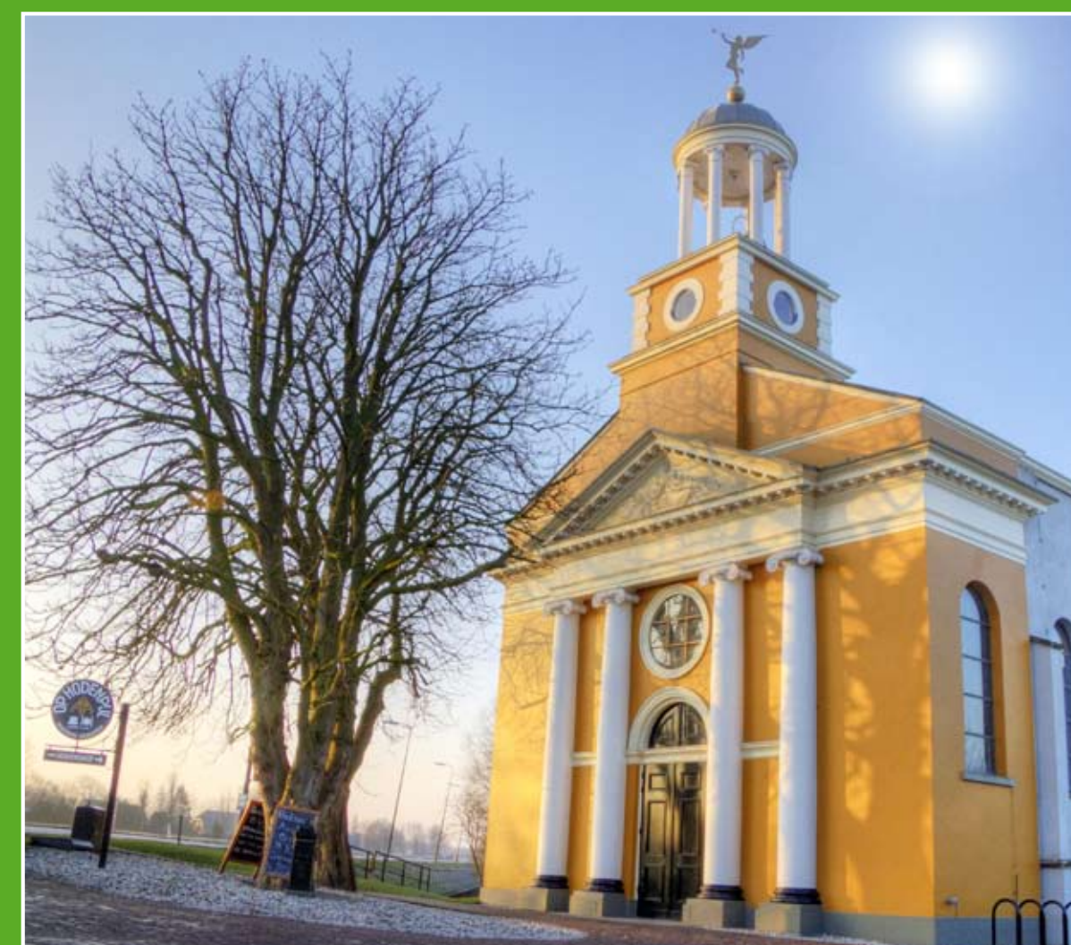
③ Op Hodenpijl (10 km)

Op Hodenpijl is een bourgondische buitenplaats waar cultuur, kunst, gezondheid en welzijn bij elkaar komen. Proef de smaken van Midden-Delfland in het biologische restaurant, bezoek een lezing, concert of expositie. Of kijk rond in de stal en (moes)tuinen die het restaurant voorzien van zuivel, vlees en groenten. Adres: Rijksstraatweg 20/22 Schipluiden. Openingstijden restaurant: di. t/m zo. vanaf 10.00 uur.