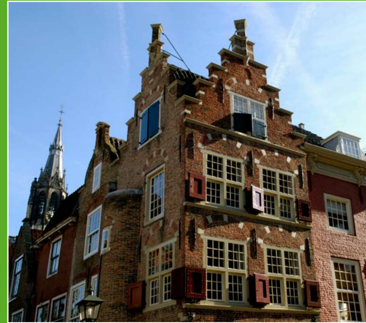
① Historische binnenstad Delft (4 km)

Delft heeft een autoluwe binnenstad en is daarom een aantrekkelijke stad voor wandelaars en fietsers. Vanuit de stad bent u zo in de aangrenzende groene buitengebieden waar u mooie wandel- en fietstochten kunt maken. Onderweg geniet u van de waterrijke omgeving.