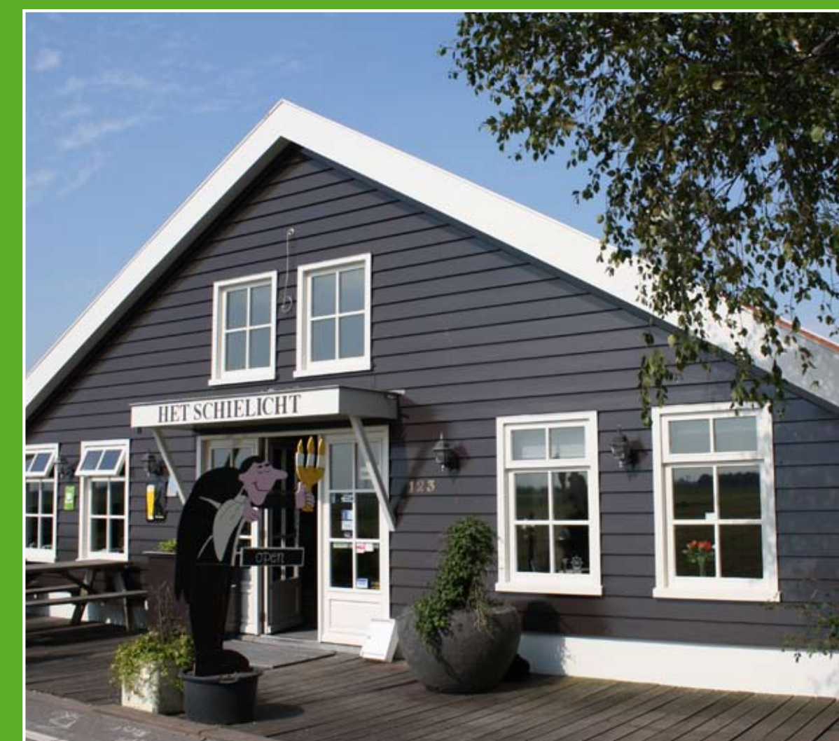
④ Het Schielicht (3 km)

Op Hodenpijl is een bourgondische buitenplaats waar cultuur, kunst, gezondheid en welzijn bij elkaar komen. Proef de smaken van Midden-Delfland in het biologische restaurant, bezoek een lezing, concert of expositie. Of kijk rond in de stal en (moes)tuinen die het restaurant voorzien van zuivel, vlees en groenten. Adres: Rijksstraatweg 20/22 Schipluiden. Openingstijden restaurant: di. t/m zo. vanaf 10.00 uur.