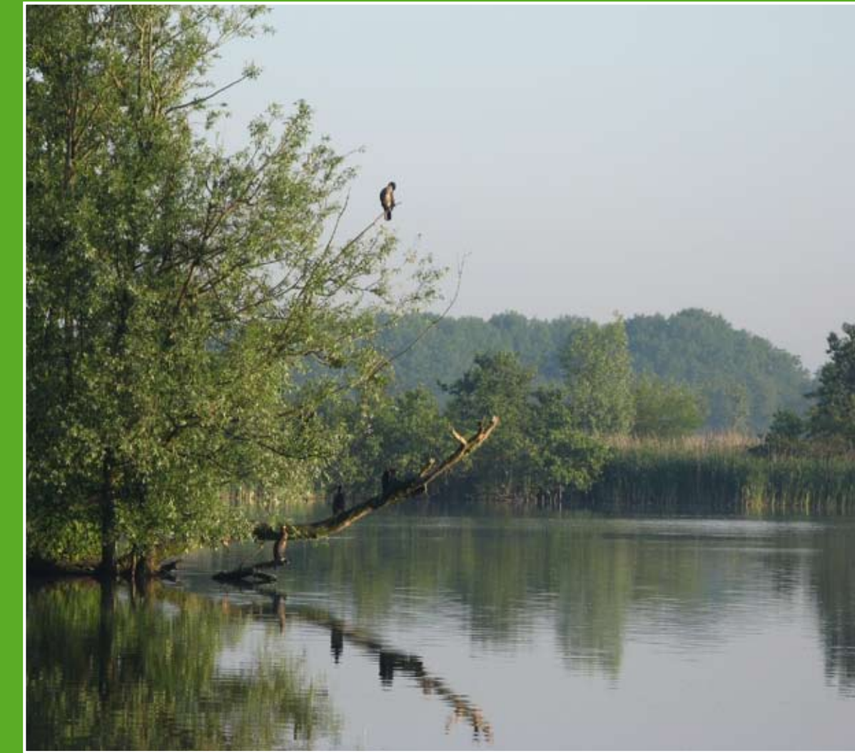
② Akerdijkse Plassen (5 km)

Delft heeft prachtige grachten met eeuwenoude grachtenhuizen, hofjes, kleine steegjes, vele boogbruggen en een Markt met een schitterend stadhuis. De historische binnenstad is goed bewaard gebleven, de middeleeuwse structuur is nog overal herkenbaar. Delft heeft een autoluwe binnenstad. Dat maakt Delft ook zo fijn voor wandelaars en fietsers.