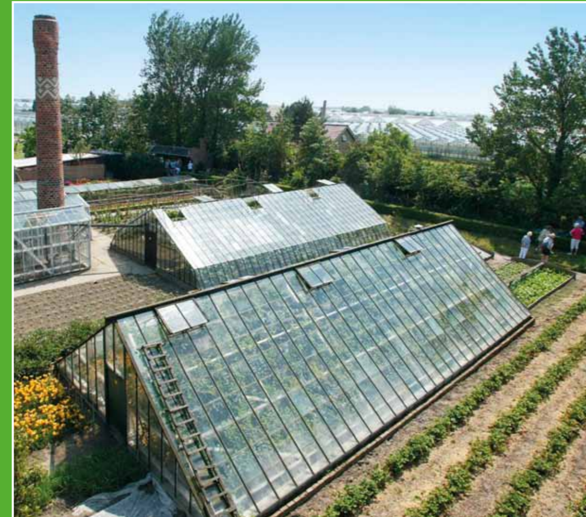
① Westlands Museum

De historie van het Westland en de ontwikkeling van de (glas)tuinbouw komen tot leven in het Westlands Museum. In de historische tuin worden producten gekweekt zoals de tafeldruif, perziken, pruimen en asperges. Hier ziet u ook een ingerichte tuindersschuur uit ± 1900. Adres: Middel Broekweg 154, Honselersdijk. Openingstijden: di t/m za en elke 1e zo v/d maand 13.30-17.00 uur. Jul. en aug. extra geopend van di t/m vr 10.30-17.00 uur.