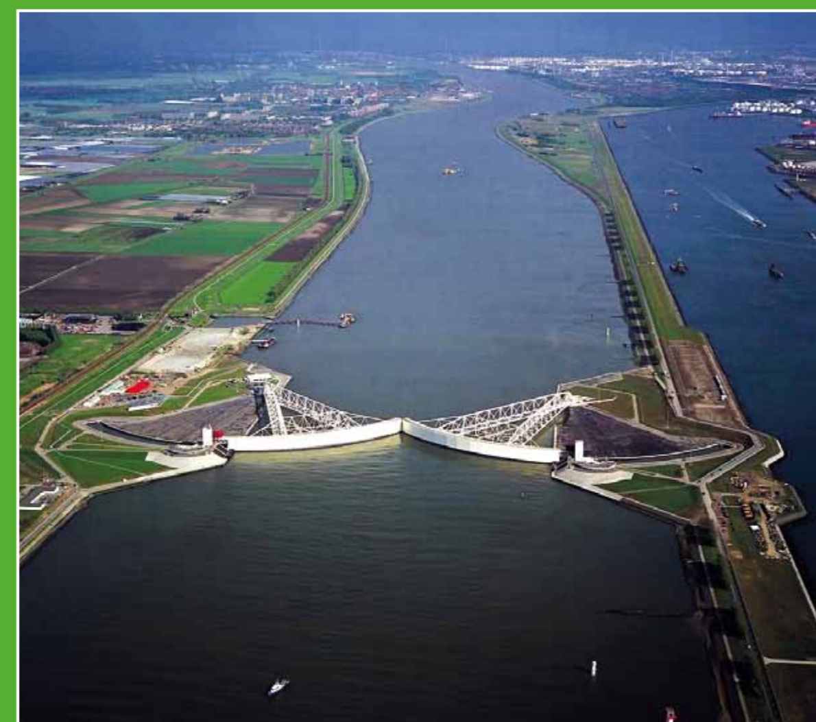
③ Maeslantkering & Nieuwe Waterweg

De historie van het Westland en de ontwikkeling van de (glas)tuinbouw komen tot leven in het Westlands Museum. In de historische tuin worden producten gekweekt zoals de tafeldruif, perziken, pruimen en asperges. Hier ziet u ook een ingerichte tuindersschuur uit ± 1900. Adres: Middel Broekweg 154, Honselersdijk. Openingstijden: di t/m za en elke 1e zo v/d maand 13.30-17.00 uur. Jul. en aug. extra geopend van di t/m vr 10.30-17.00 uur.