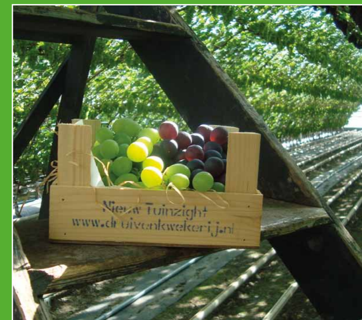
④ Druivenkwekerij Nieuw Tuinzicht

Naaldwijk geldt als hét centrum van het Westland en is een leuke plaats voor een tussenstop. Aan het Wilhelminaplein staan enkele monumenten zoals de hervormde kerk (begin 14e eeuw), het Heilige Geesthofje (1496) en het Raadhuis (1632), dat lange tijd heeft gefungeerd als Rechthuis. Net buiten Naaldwijk ligt de indrukwekkende bloemenveiling FloraHolland.